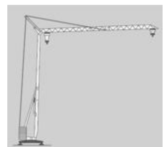
Grue à tour à montage automatisé (GMA) Conduite au sol