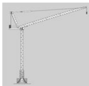
Grue à tour à flèche relevable à montage par éléments (GME) Conduite en cabine